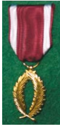
De Gouden Palm van de Kroonorde voor 45 jaar dienst.

De toekenning van de Gouden Palmen van de Kroonorde is voorbehouden voor werknemers met 45 jaar dienst. Deze onderscheiding kan ook worden toegekend tijdens de pensionering indien de kandidaat 40 jaar dienst heeft. Voor de Gouden Medailles van de Kroonorde komen werknemers met 35 jaar dienst in aanmerking. Tussen deze twee nominaties in de Nationale Orden is weliswaar een tijdsperiode van 10 jaar