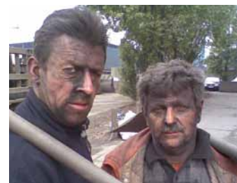
Deze havenarbeiders hebben hun kledijvergoeding meer dan verdiend!

Beiden zijn gepassioneerd door hun job. "Elke dag is anders: we weten 's morgens nooit wat ons te wachten staat. Die diversiteit en afwisseling houden het boeiend. Ook het contact met de klanten en het probleemoplossend werken geeft enorm veel voldoening. Door onze wijdverspreide netwerking kunnen wij veel misverstanden helpen oplossen, enkel door te observeren, correct te informeren en direct te communiceren voordat er een probleem ontstaat. Natuurlijk zijn we ook maar zo sterk als het Cepa-team dat achter ons staat, maar door die dagelijkse feedback naar havenafdeling en directie kunnen wij veel sneller en doeltreffender optreden."