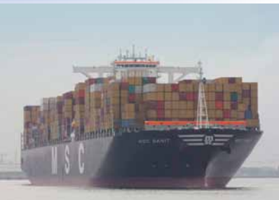
De containerreus 'MSC Danit' met 14,5 m diepgang heeft dankzij de scheldeverdieping in januari voor het eerst onze haven aangedaan.

Sinds 24 december 2010 is de verdieping van de Schelde afgerond. Daardoor kunnen schepen met een diepgang tot 13.10m nu op elk moment open afvaren. Voor schepen met een grotere diepgang worden de tijpoorten aanzienlijk ruimer. Als gevolg van die grotere tijvensters kunnen er gedurende éénzelfde tij meer schepen met grotere diepgang geschut worden. Het economisch belang van deze verdiepingswerken kan niet genoeg onderstreept worden.