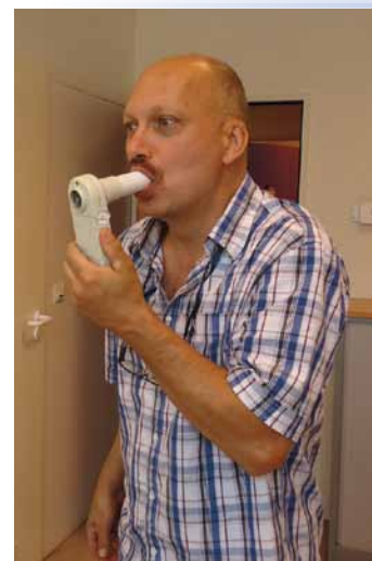
De longfunctietest behoort tot het standaard onderzoek.

maar ook op de juiste plaats. Ze appreciëren je werk en dat schept een band." Soms is het ook lachen geblazen: "We zijn ooit eens een havenarbeider vergeten in de kleedkamer. Hij wachtte daar tot hij zou binnengeroepen worden door een dokter, maar was in slaap gevallen en door omstandigheden was ook de dokter hem vergeten. Een personeelslid van de administratie schrok zich rot toen een man in ondergoed in de keuken even kwam polsen "of ze hem toevallig vergeten waren". En dan heb je ook nog de grote bincken die lijkbreek wegtrekken als ze hun griepsputje moeten krijgen... Altijd grappig om te zien."