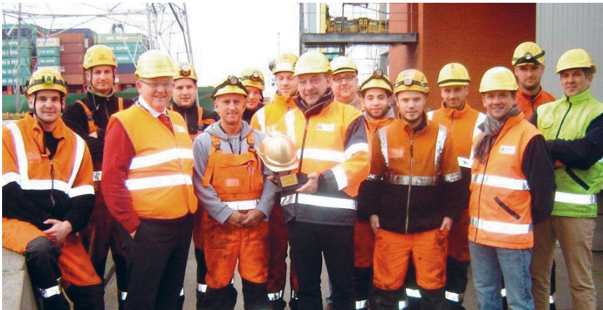
DP World havenarbeiders fier op hun 'gouden helm award' wisseltrofee

Het thema "veiligheid is de taak van iedereen" is één van de belangrijkste pijlers van het gemeenschappelijk veiligheidsbeleid van de haven van Antwerpen. Het streefdoel is een veiligheidscultuur die door iedereen wordt gedragen. We kunnen pas spreken van een veiligheidscultuur als ook iedereen overtuigd is van het belang van een goed evenwicht tussen veiligheid en productie, en dit in een veilige en gezonde omgeving waar iedereen respectvol met elkaar omgaat.