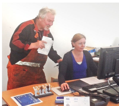
Vliegend loket in actie

Net zoals vorig jaar gingen enkele medewerkers van de afdeling haven van Cepa tijdelijk op locatie aan het werk. Gedurende de hele maand maart werden elke maandag en dinsdag zogenaamde 'vliegende loketten' geopend op MSC Home Terminal of AET. De vliegende loketten werden vorig jaar in het leven geroepen om havenarbeiders in los dienstverband de kans te bieden hun vakantie sneller te laten registreren. We hadden gemerkt dat sommigen moeilijk op tijd bij Cepa geraken en dus te laat waren om in de gewenste periode vakantie te nemen.