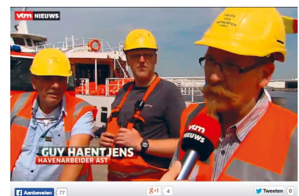
Op het nieuws mochten de havenarbeiders toelichten hoe ze te werk gingen bij de reddingsactie