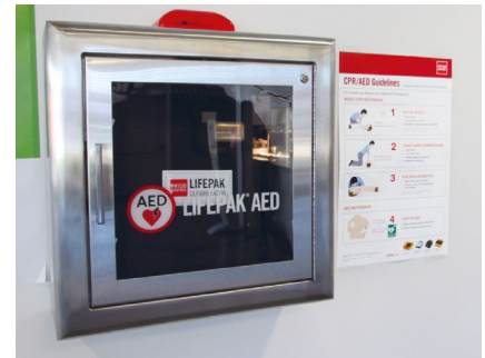
Het levensreddende AED-toestel in het schaftlokaal aan de Zomerweg