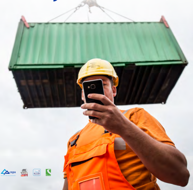
In het voorjaar verschijnen de campagnebeelden op de kaai.