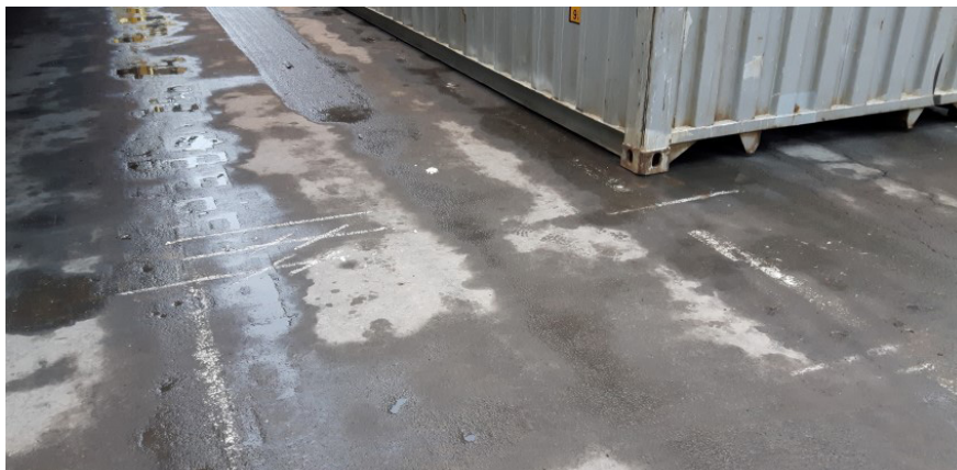
Krijtlijnen onder de kraan

Kunnen deze technische middelen niet ingezet worden, dan kan er mogelijk een markering op de grond aangebracht worden waarmee de bestuurders zich kunnen oriënteren. Dit gebeurt