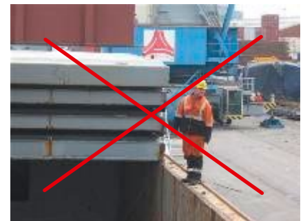
Fout voorbeeld: uitwijzen vanop de canus