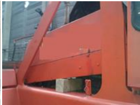
blokkering door blok hout