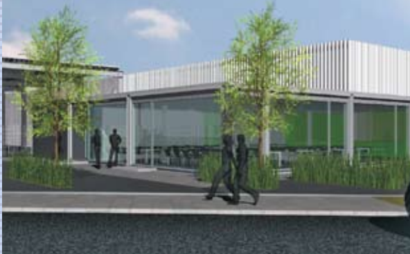
Een buitenzicht van de nieuwe schaftruimte.

Zo creëren we een extra ruimte voor opleidingen en voor de opslag van materiaal. Vlakbij Ocha zal Cepa ook een nieuw gebouw laten optrekken waar de personeelsleden van de Afdeling Preventie & Bescherming hun intrek zullen nemen.