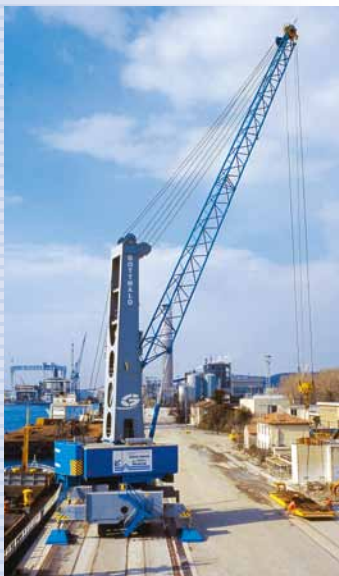
De nieuwe HMK 260 E-kraan

Ook toekomstige Antwerpse kraanmannen kunnen het vak voortaan op een echte kraan aanleren en niet langer via een simulator.