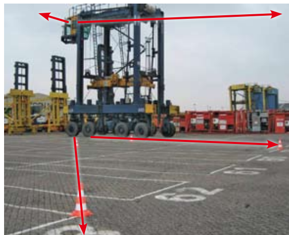
Dode hoek die door camera wordt weergegeven