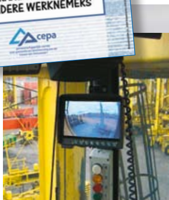
Display in straddle carrier

Sommige voertuigen zijn uitgerust met hulpmiddelen om het dode hoek-probleem zoveel mogelijk te beperken. Bv. straddle carriers zijn voorzien van speciale dode hoek-camera's.