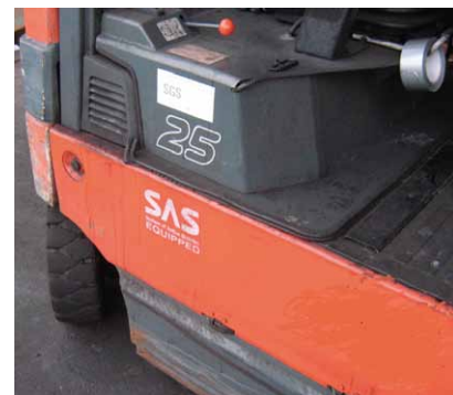
Stilstaande heftruck met gedraaide wielen