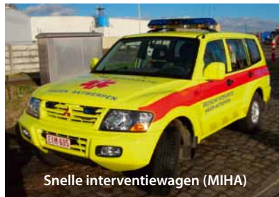
Snelle interventiewagen (MIHA)