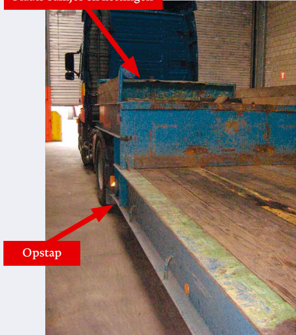
Plaats balkjes en kettingen

Naar aanleiding van dit ongeval werd de dieplader aangepast om het op- en afstappen te vergemakkelijken en te beveiligen (foto rechts). Op de opstapplaats werden een handvat en antislip-strips aangebracht. De onderste trede werd verbreed met een opklapbaar gedeelte.