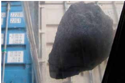
Steen op ruit (dak) kapstok.

In de voorbije maand werden een aantal incidenten met vallende brokstukken en twistlocks gemeld, waarbij werknemers ei zo na geraakt werden of voertuigen werden beschadigd.