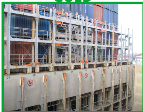
Goed voorbeeld: vaste leuning