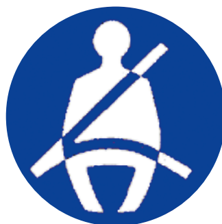
Pictogram 'verplichte gordeldracht'