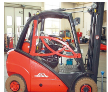
Veiligheidsvoorziening met contact op heftruck