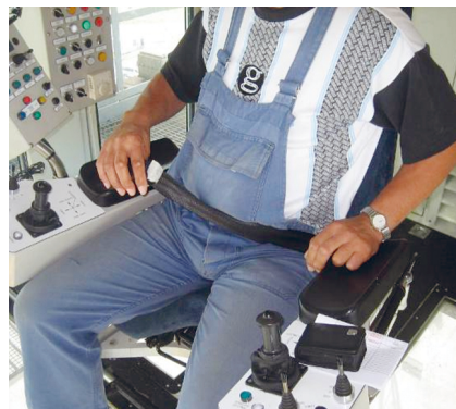
Gordel in kraan

De verplichte gordeldracht wordt met een pictogram aangeduid (zie hieronder).