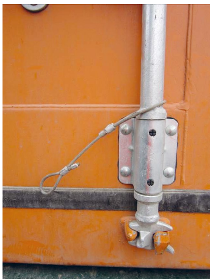
Beveiliging met kabel

Dus: altijd beveiligen, die containerdeuren! Dat kan met een eenvoudig hulpmiddel: een koordje of kabeltje volstaan.