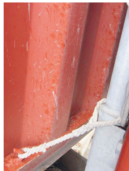
Beveiliging met koordje