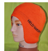
Type 4: Beanie ear protect