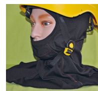
Type 3: Balaclava