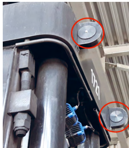
Afgedichte aanslagogen op de mast

Alle informatie over het aan boord brengen van heftrucks is terug te vinden in instructiekaart ST-VIK-058.