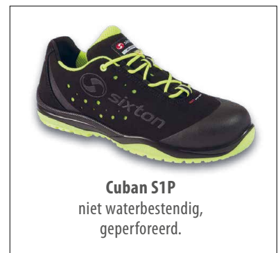
Cuban S1P niet waterbestendig, geperforeerd.

De voornaamste aandachtspunten bij de keuze van een comfortabele chauffeursschoen zijn: de soepelheid van de zool, het warmte- en koudegevoel, de metaalvrijheid en -uiteraard- het algehele comfortgevoel tijdens de uitvoering van de taak. Na een uitgebreide voorselectie werden er finaal 3 modellen getest door 18 chauffeurs. Twee ervan behaalden dezelfde "hoge" scores en werden aan het schoengamma toegevoegd. Ze vervullen een specifieke behoefte binnen het assortiment. Dat betekent dat ze enkel beschikbaar zijn voor categorieën 002/003/453/455/456/162/163. Puntenprijs: 1340 kledijpunten.