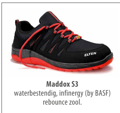
Maddox S3 waterbestendig, infinergy (by BASF) rebounde zool.

Beschikbaar in het Kledijbedelingscentrum vanaf 15/07/19