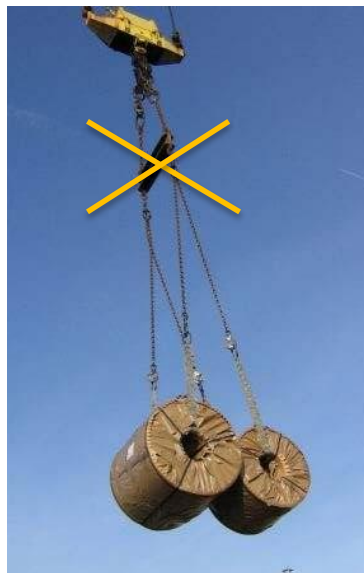
Coils met brug