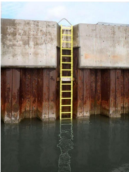
kaailadder – in het geel