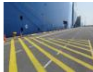
belijning – voorbeeld 'dedicated zone'