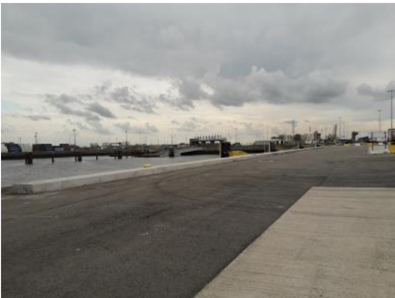
gegoten betonnen boord