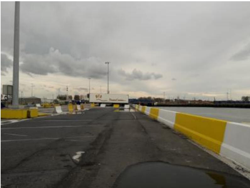
volle betonnen boord