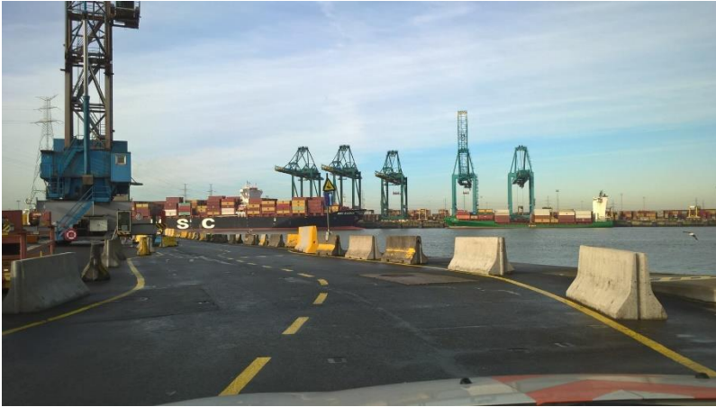
belijning – voorbeeld rijweg