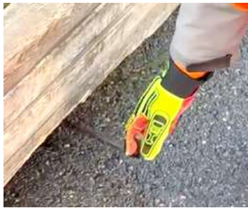
Steek je handen niet onder de last