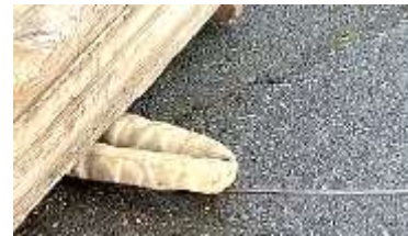
Trek in een rechte beweging het aanslagmateriaal onder de last door zodat je vlot aan het aanslagmateriaal kan zonder je handen onder de last te steken.