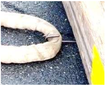
Steek de sleehaak net zover dat aanslagmateriaal er vlot in kan