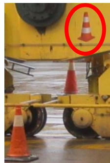
Fig. 2 – Kegelsticker op kraanpoot