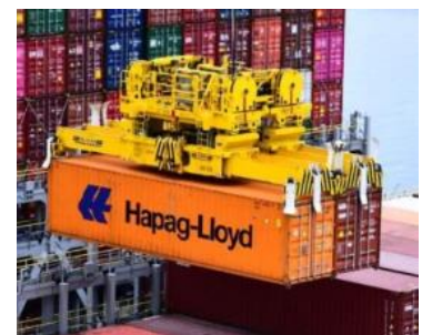
Fig. 4 – Tandem lift