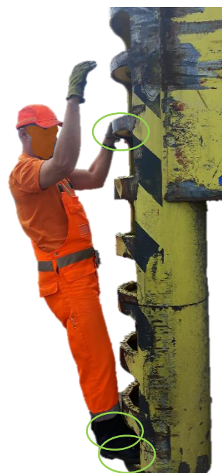
1 hand en 2 voeten