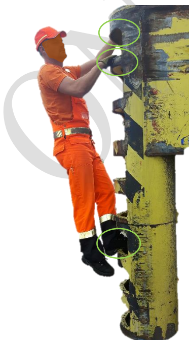
2 handen en 1 voet