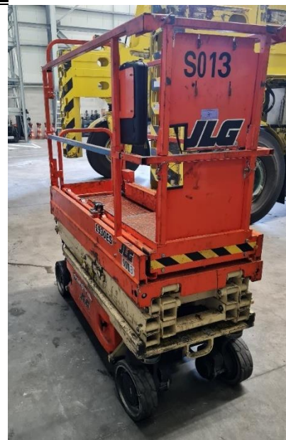
Foto 4: valbeveiliging aan tussenleuning schaarlift (hier blauw gekleurd)