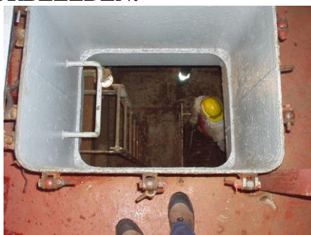
Vlot toegankelijk en verlichte mangat