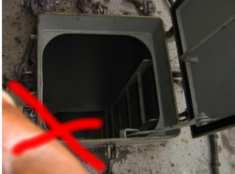
Niet verlicht mangat