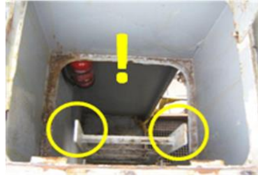
Hinder voor kledij, toegang