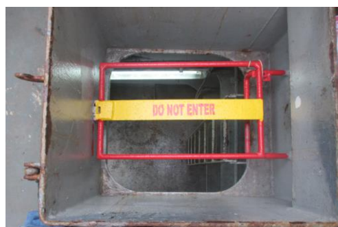
Fysische blokkering/vergrendeling van toegang.