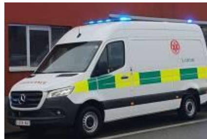
mobile hulp post