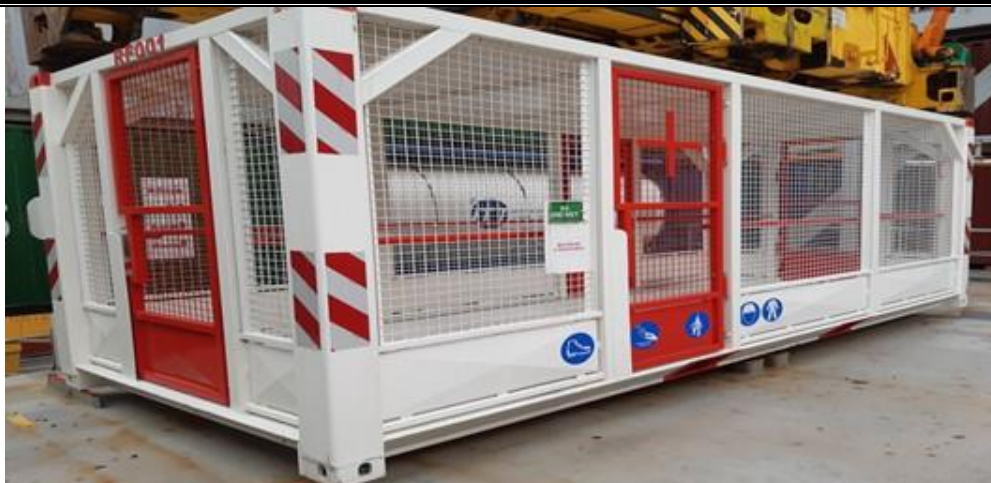
Voorbeeld personenevacuatiefat (PEF)