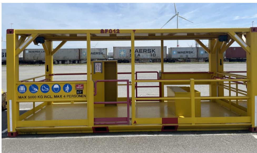
Voorbeeld safetyflat (SF)