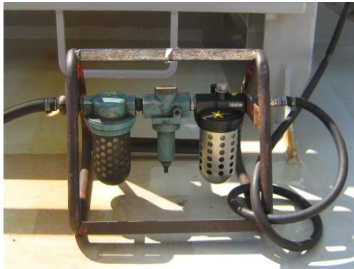
Luchtbehandelingseenheid of "filterbak"