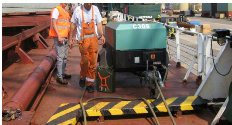
Compressor aan dek