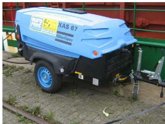
Compressor aan de wal