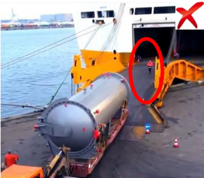
Geen personen op de ramp toegelaten