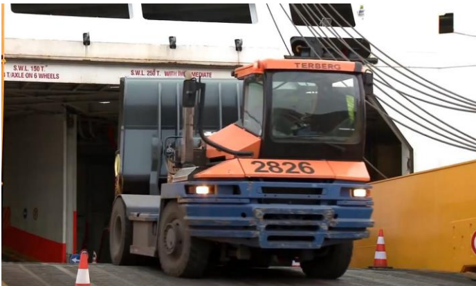
Zwaar goed op de ramp