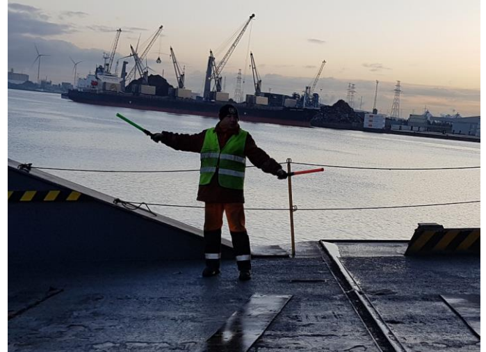
Uitwijzer op ramp