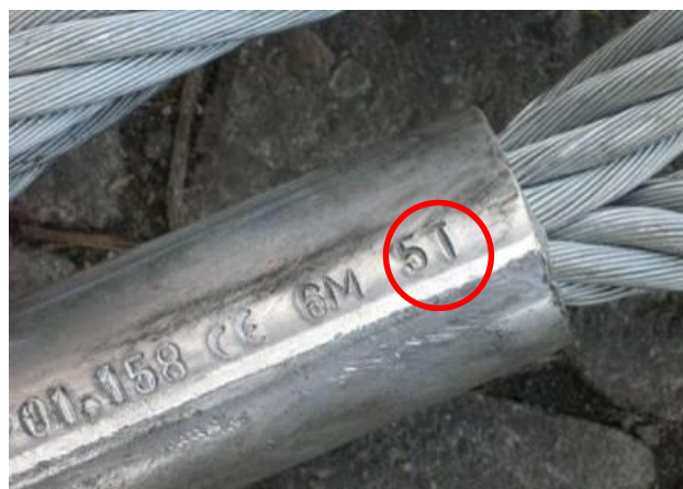
VWB Talurit klem