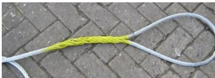
Gesplitste wire met kleuraanduiding (VWB)