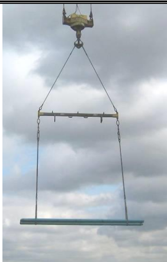
Gebruik hijsbanden voor overdraaien losse buizen